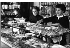
Konditorei-Verkäuferinnen