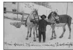
Unbek., ca. 1910 15/05