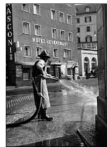
Frühlingsputz auf der Via Somplaz A. Pedrett, ca. 1935 15/14