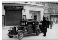
Der Gemeindepolizist ca. 1930 15/22*