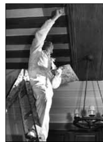
FrISChe Farbe für die Kulm-Bar J. Allen Cash, ca. 1955 15/16*