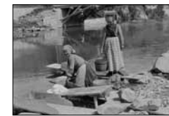
Wäscherinnen am Inn bei Punt da Piz Unbek., ca. 1910 15/09