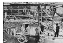
Bauarbeiten Via Maistra 1 Unbek., ca. 1925 15/29