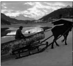
Holzfuhr am See A. Pedrett, 1953 15/07