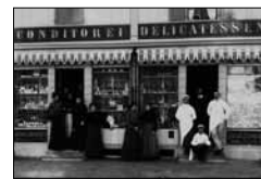
Ladenpersonal an der Via San Gian Lienhard & Salzborn, ca. 1900 15/17*