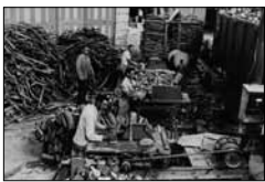
Brennholz zuschneiden beim Bahnhof Unbek., ca. 1955 15/08