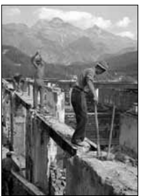
Abriss Grand Hotel A. Pedrett, 1947 15/31