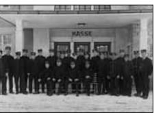
Bahnpersonal Unbek., 1939 15/24