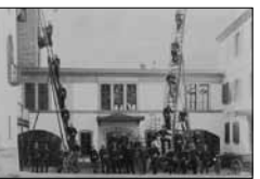
Feuerwehr beim Kulm Hotel Unbek., ca. 1900 15/23