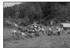
Heuernte in Surpunt, rechts Fassung Surpuntquelle R. Guler, Juni 1890 15/02