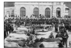
Viehmarkt auf der Piazza da Scoula, ca. 1895 15/01