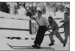
Suvretta Skilift Keystone, ca. 1936 15/12*