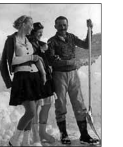
Eismeister mit Gästen Unbek., ca. 1925 15/11