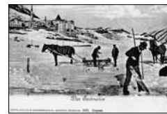
Eisschneider auf dem St. Moritzersee H. Guggenheim, ca. 1905 15/04*