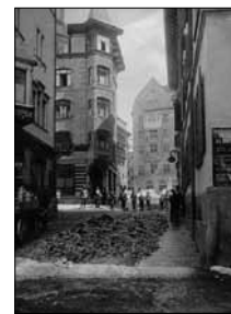
Eisräumung auf der Via Maistra Unbek., ca. 1915 15/13