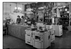
Im Elektro-Fachgeschäft Unbek., ca. 1955 15/18