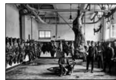
Schlachthaus Punt da Piz R. Zinggeler, ca. 1918 15/15*