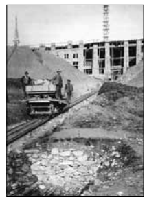
Bau Grand Hotel Unbek., 1903 15/30*