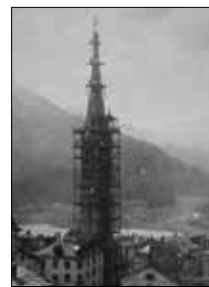
Turm der Dorfkirche im Bau Unbek., 1897 15/28