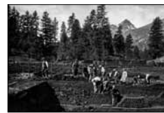
Torfgewinnung Lej Marsch R. Zinggeler, 1918 15/03*