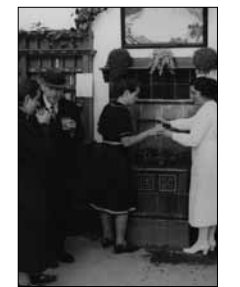
Ausschank Mineralwasser in der Paracelsus-Quelle Unbek., ca. 1930 15/21