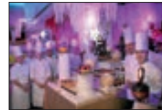
Buffet Kitchen Party 2011 12/13/11