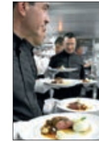
Great Valser Corviglia 2011 12/13/07