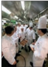
Palace Küche 2006 12/13/29