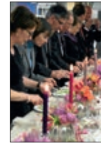
Giardino Mountain 2012 12/13/04