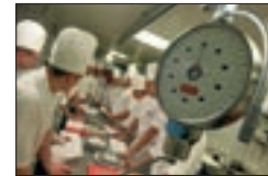
Team Küche 2011 12/13/10