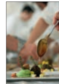
Detail 2008 12/13/21