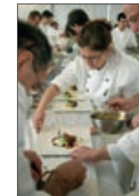
Teamwork Zelt 2008 12/13/22