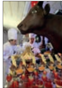
Dessert Buffet 2006 12/13/30