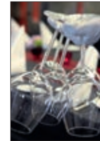
Weinglässer 2011 12/13/13