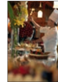
Chocolate Cult 2011 12/13/15