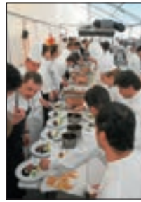
Küche Zelt 2007 12/13/26