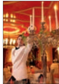
Kerzen Fascination Champagne 2010 12/13/09

The St. Moritz Gourmet Festival will celebrate its 20th anniversary in 2013 – a good enough reason to take a look back. Visitors to the Serletta multi-storey car park will be able to share the best moments from the Festival's celebration of the art of international gastronomy and its event culture: impressions from the last 19 Festival years will be on display in 31 photos. The exhibition is being made possible thanks to the St. Moritz Tourist Board and hotellerieuisse St. Moritz, which deserves every thanks for its financing and organisational support. The St. Moritz Gourmet Festival can look back on an unparalleled success story. During the past 19 years, it has attracted more than 60,000 gourmet fans to the Engadine, who had the pleasure of enjoying the culinary highlights created by a total of 173 international master chefs from 31 nations at its stunning partner hotels and event venues – a whole week long! The 20th St. Moritz Gourmet Festival will take place from 28th January to 1st February 2013. For a full programme of events and reservation options, please visit www.stmoritz-gourmetfestival.ch . If you have individual questions or requests, please contact the Festival hosts or the St. Moritz Tourist Board.