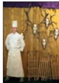
Koch vor Hirschgeweih 12/13/24