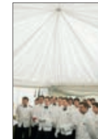
Serviceteam 2008 12/13/23