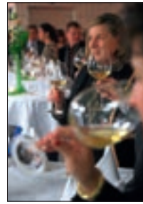
Gourmet Safari 2007 12/13/01