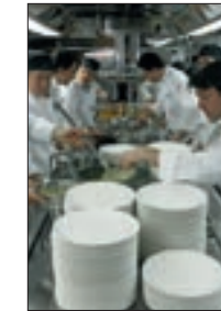
Great Mountain Gourmet Finale 2010 12/13/14