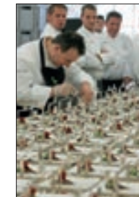
Dessert Zelt 2008 12/13/20