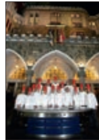
Gruppenfoto 2006 12/13/31