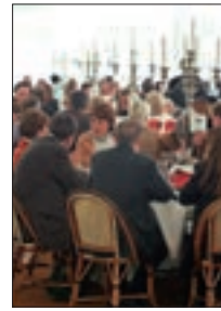
Gäste Zelt 2006 12/13/28