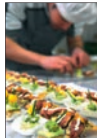
Häppchen 2009 12/13/18