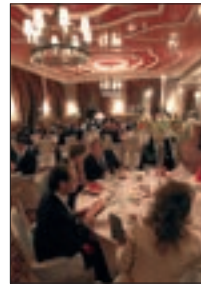
Fascination Champagne Suvretta 2010 12/13/08