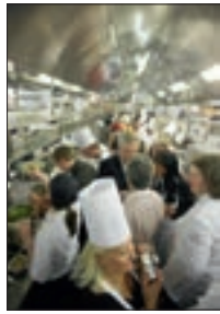
Kitchen Party 2008 12/13/25